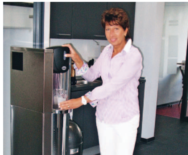
Bild: Tafelwasseranlage im Verwaltungsgebäude SWA

Generell gilt, wenn wir Durst verspüren, müssen wir trinken, um unsere Leistungsfähigkeit und Gesundheit zu erhalten.